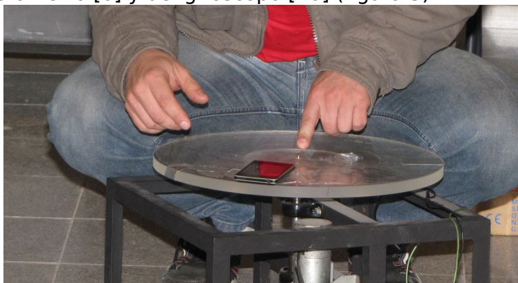
Fig. 3. Plataforma giratoria para el estudio del movimiento circular.

En esta experiencia se estudia el movimiento circular de un objeto. Para ello se utiliza el "teléfono inteligente" como cuerpo y se registrará el movimiento utilizando los sensores del acelerómetro [6] y del giróscopo [10] (figura 3).