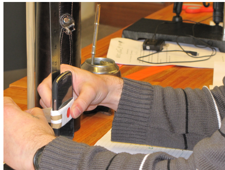
Fig. 4. Montaje experimental para el estudio del péndulo físico.

Un sistema físico paradigmático como es el péndulo físico se estudia usando los sensores de aceleración y rotación disponibles en los teléfonos inteligentes ( smart-phones ) y en otros dispositivos como lpads , o tablets [10]. En nuestra experiencia un teléfono inteligente se fija en la parte exterior de una rueda de bicicleta y se pone en movimiento tanto en régimen de rotación (dando vueltas completas en una dirección) como de oscilación ya sea de pequeños o de grandes ángulos. Los montajes experimentales se indican en las figuras 4 y 5.