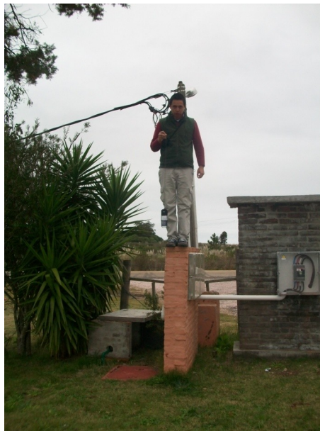
Fig. 2. Voluntario a punto de saltar al vacío provisto de un celular.

¡Si, aunque usted no lo crea es posible hacer un experimento con gravedad cero ! ¿Cómo se consigue el efecto de ingravidez en la Tierra? ¿Cómo hacemos para que los objetos no pesen ? En realidad es muy fácil si aplicamos la física. No vamos a hacer que no actúe la gravedad, más bien haremos que el peso sea nulo durante unos instantes. En la figura 2 se muestra un ejemplo de esta situación. Este fenómeno de ingravidez se puede relacionar con los vuelos zero-g (trayectoria parabólica controlada) que se organizan para el entrenamiento de astronautas y de modo un poco más físico con el principio de equivalencia, la imposibilidad de diferenciar un campo gravitatorio de un sistema acelerado.