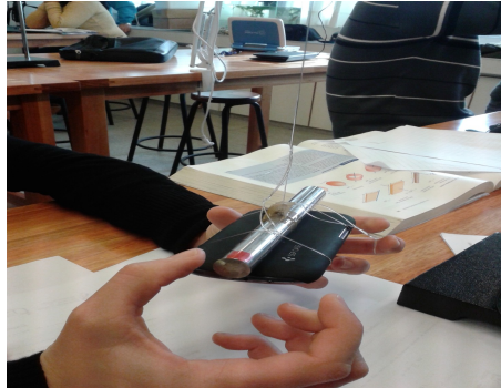
Fig. 6. Péndulo de torsión sujeto al celular.

suspendido verticalmente, con su extremo superior fijo y de cuyo extremo inferior se cuelga una barra u otro cuerpo con un cierto momento de inercia. En la figura 6 se muestra el montaje experimental correspondiente. Se estudia, por ejemplo, la dependencia del período de oscilación del péndulo de torsión con el momento de inercia de la barra.