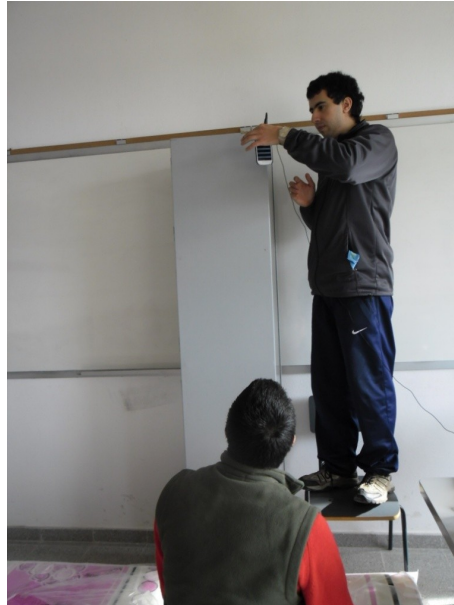
Fig. 1. Lanzamiento del celular en la experiencia de caída libre.

Para determinar la aceleración de la gravedad, una posibilidad sencilla es dejar caer el celular como se ilustra en la figura 1 (asegurándonos que cae sobre una superficie lo suficientemente blanda para que no se rompa) y registrar la aceleración según el eje vertical. Durante el lapso de caída libre el acelerómetro registrara una aceleración debida al campo gravitatorio. Luego, midiendo este lapso de tiempo se puede determinar el tiempo de caída y usando la distancia recorrida, el valor correspondiente de aceleración.